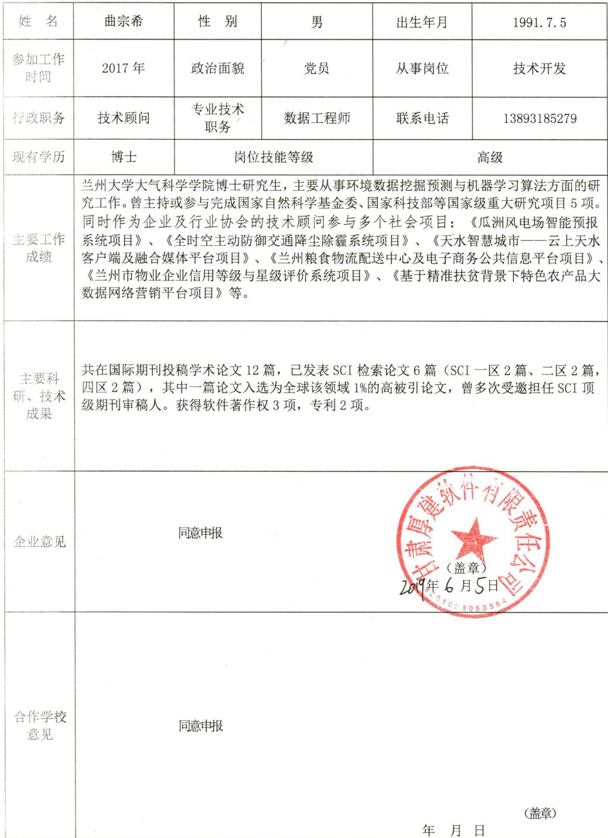
表 5：甘肃省职业教育名师工作室成员申报表（企业成员）